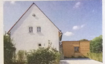
Bestand sensibel saniert, die Grundrisse weitgehend erhalten.

Die 300 Typenhäuser der Regensburger Ganghofersiedlung stehen einzeln und als Ensemble unter Denkmalschutz. Ihr Gesamtbild muss erhalten bleiben. Das Reglement lässt jedoch Spielraum für individuelle Lösungen.