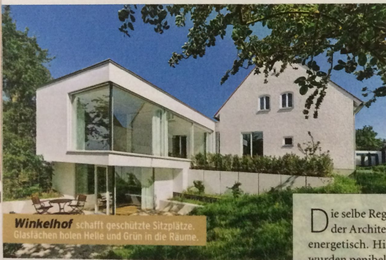
Winkelhof schafft geschützte Sitzplätze. Glasflächen holen Helle und Grün in die Räume.