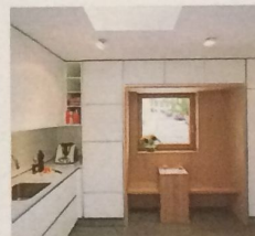
Möbelbau Sitzplatz mit Blick zum Eingang.