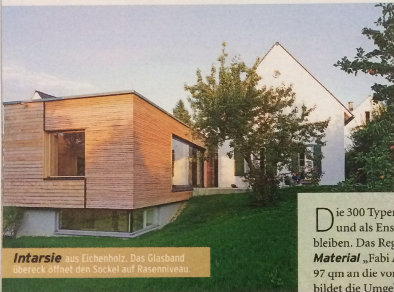
Intarsie aus Eichenholz. Das Glasband überdeckt öffnet den Sockel auf Rasenniveau.

Im 34. Wettbewerb suchten DAS HAUS und die Landesbausparkassen nach Gebäuden, die vorbildlich modernisiert und vergrößert wurden, die Neues unverwechselbar mit der Kraft des Alten koppeln. Von 61 Einsendungen wurden zehn prämiert. Hier sehen Sie einen Hauptpreis, anschließend die weiteren neun Gewinner.