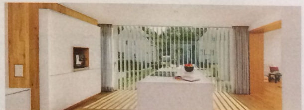
Lichtblick Die Küche zur Straße verglast, weiße Lamellen schützen vor Blicken. Rechts der Übergang ins Siedlungshaus.

Die selbe Regensburger Siedlung, anderes Haus: „Berschneider Berschneider Architekten“ ordneten die Grundrisse des Altbaus neu, sanierten ihn energetisch. Historische Details, etwa der grobe Putz und Verwahrungen, wurden penibel nachgebaut oder ergänzt. Anbau Gelände gestuft, zwei vollwertige Etagen entstanden, Familie Semrau/Ahrens kann die untere als Einliegerwohnung nutzen. Die Wohnfläche wuchs um 90 qm auf 254 qm. 🏠