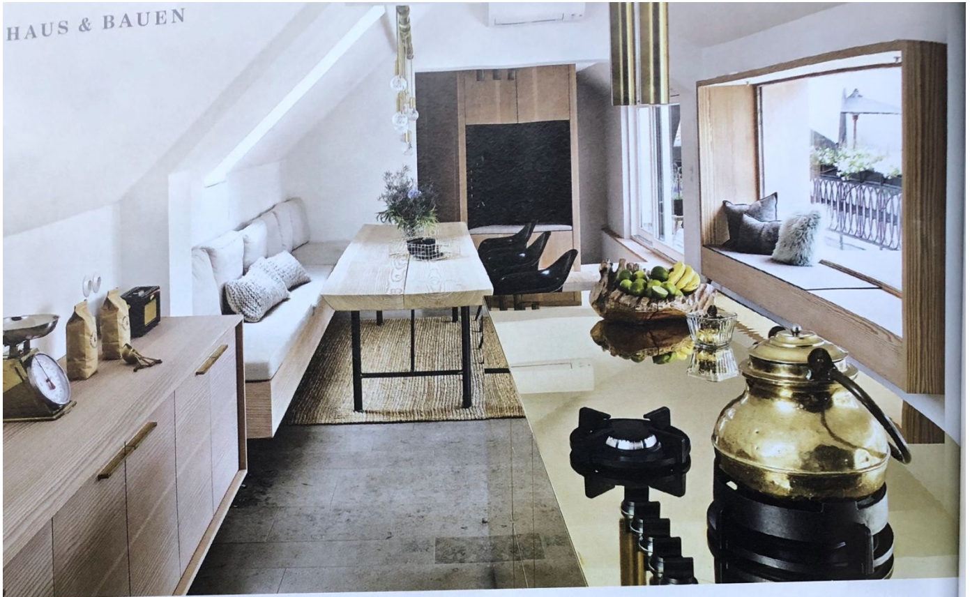
SCHÖNE KONTRASTE Messing setzt in der Wohnküche glanzvolle Akzente. Der stylische Küchenblock und die Möbel aus Douglasie wurden extra entworfen und angefertigt GUTE AUSSICHT Eine mittelalterliche Szenerie umgibt die Dachterrasse. Kleinwüchsige Bäume sowie weiß und blau blühende Stauden gedeihen in Trögen. Ein Sonnensegel beschattet den Essplatz