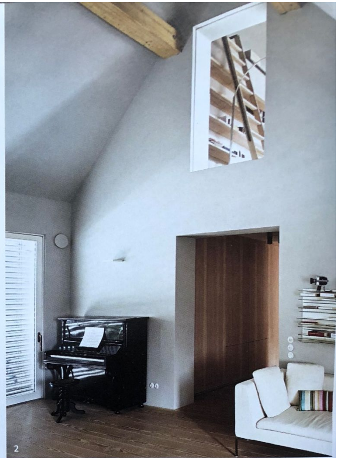
1 BESTE LAGEN Unter rustikalen Balken setzt Astrid auf weiche Grau- und Rosétöne 2 LUFT NACH OBEN Das fast sieben Meter hohe Wohnzimmer ist zur Galerie auf dem Spitzboden hin geöffnet 3 HÄUSCHEN IM HAUS Die fröhliche Almhütte im Zimmer ihres Sohnes bauten Astrid und Markus an vielen Wochenenden selbst. Die Vintage-Kindermöbel entdeckten sie in München