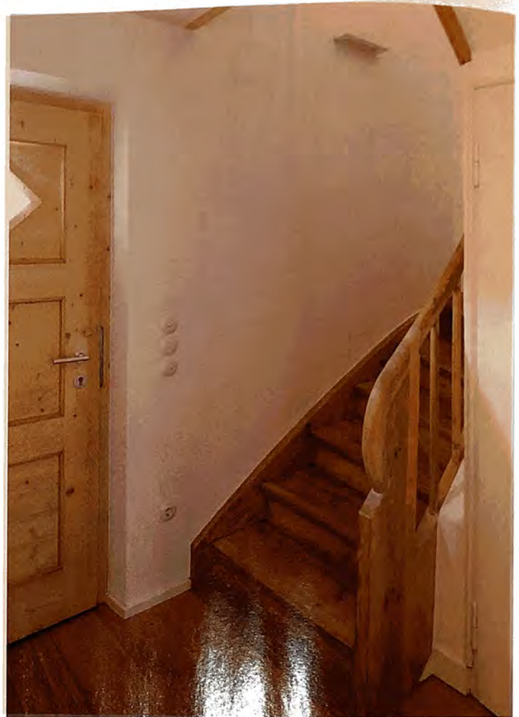
Helles, freundliches Treppenhaus im Anbau. Sanierter Altbestand des Treppenaufgangs im denkmalgeschützten Siedlungshaus.

Zur Gartenseite südwestlich bietet die große Verglasung den freien Blick auf den alten Baumbestand und fängt größtmögliche Helligkeit ein. Die Fassade erhielt eine vertikale Holzschalung, die mit dunkelgrauem Anstrich beschichtet wurde und zusätzlich zur angestrebten optischen Verkleinerung beiträgt.